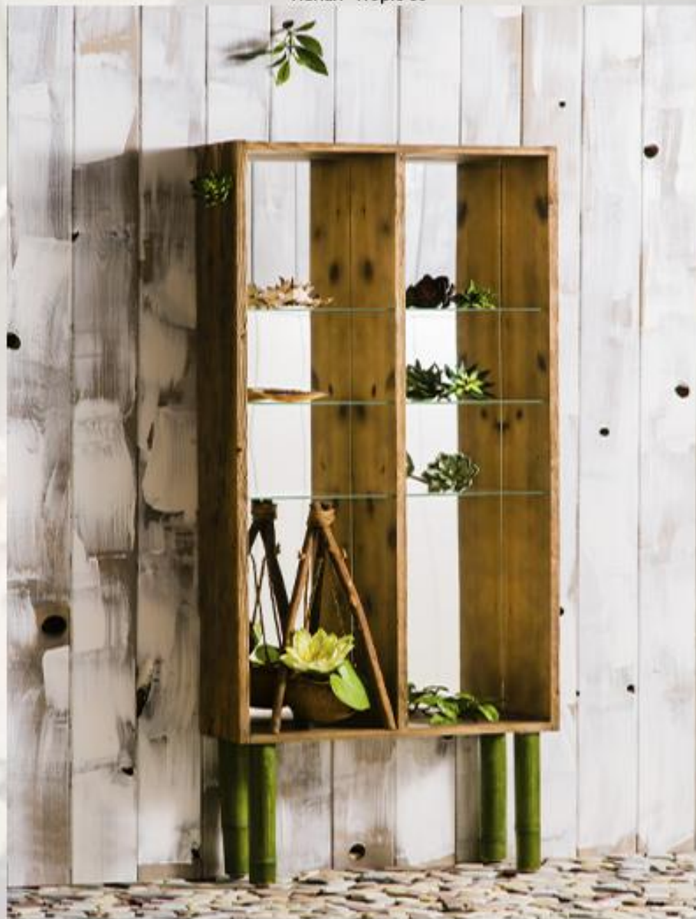
Пенал "Tropic 60"